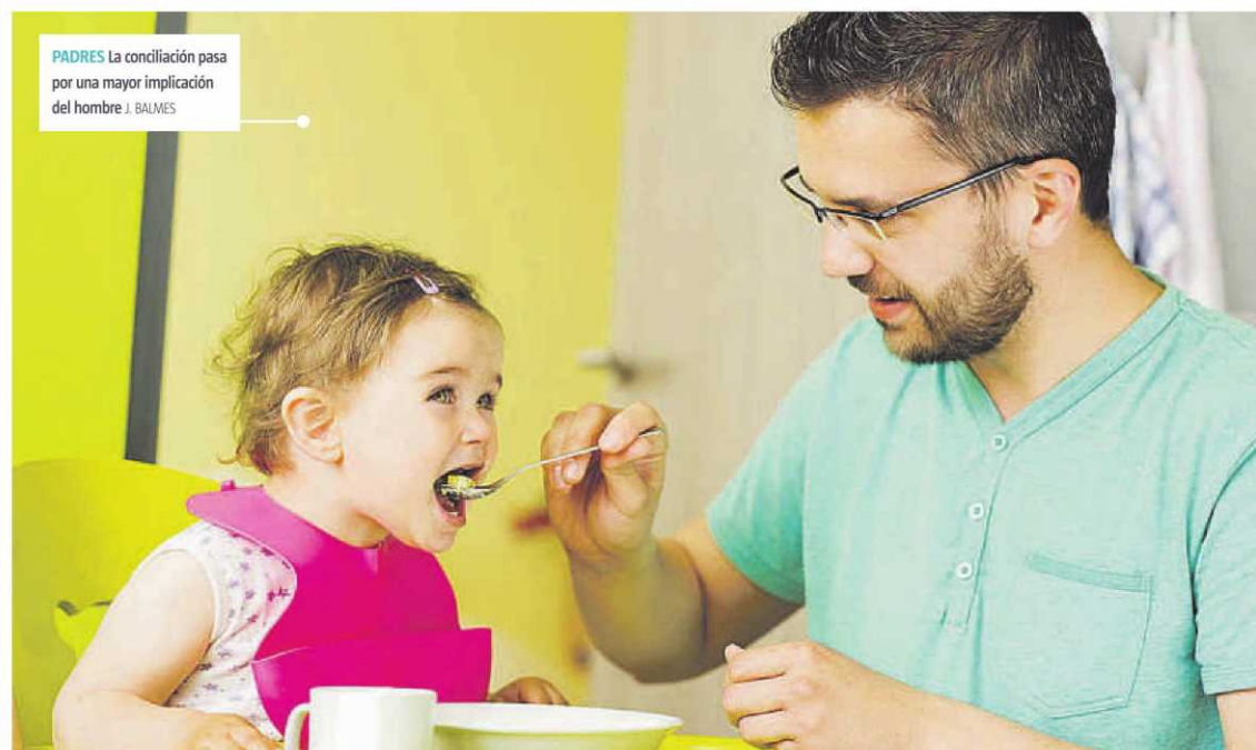
PADRES La conciliación pasa por una mayor implicación del hombre. J. BALMES

un agente de cambio". Y explica la historia de las nórdicas en tiempos de guerra: en la Primera Guerra Mundial, ellas se encargaron de las fábricas mientras ellos marchaban al frente. Terminado el conflicto, ellos volvieron a las fábricas y ellas, a casa. Con la Segunda Guerra Mundial iba a suceder tres cuartos de lo mismo, pero cuando quisieron mandarlas a casa ellas dijeron que ni hablar: se organizaron y lograron unos servicios de proximidad que aquí todavía dejan mucho que desear -en Barcelona hace cuatro años que no se abre una guardería pública-.