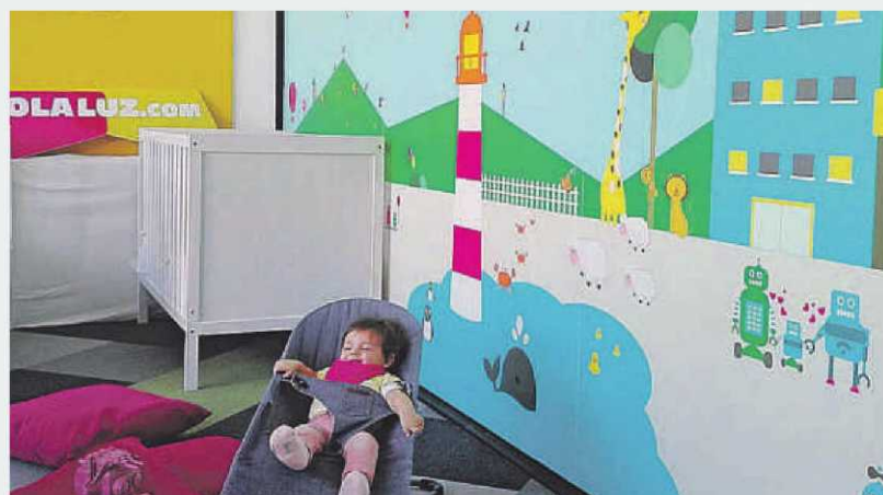
'NURSERY' A MANO Padres y madres de HolarLuz.com pueden dejar a sus hijos en la guardería que hay en la misma oficina HOLARLUZ.COM